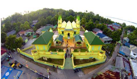
Gambar 2. Gambar Cagar Budaya Masjid Sultan Riau.

Berdasarkan penjelasan diatas maka dapat diketahui bahwa strategi pemerintah environment Dinas Kebudayaan dan Pariwisata Kota Tanjungpinang didukung oleh lingkungan cagar budaya nasional dan destinasi wisata unggulan.